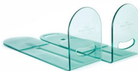
Slide de MEDICAL SYSTEM