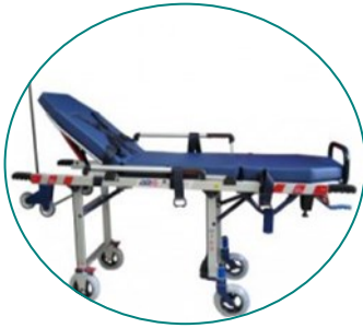
M760 de AR FRANCE