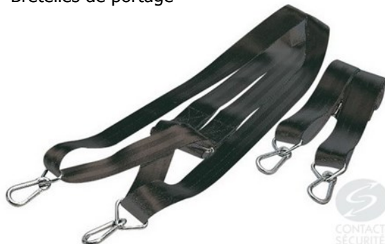
Bretelles de portage