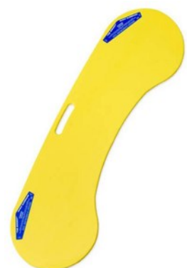
Planche glissante de TEAMALEX MEDICAL