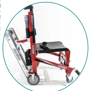
59 T EZ GLIDE POWERTRAXX de FERNO