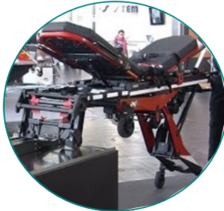
INX de FERNO