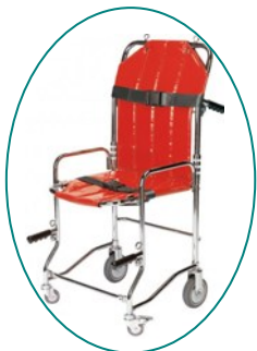
PP4 de CONTACT SECURITE