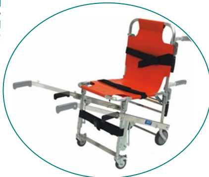
S-242 de SAVER