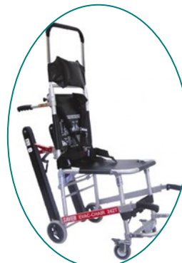
S242T POWER- TRAXX de SAVER