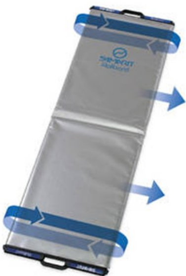
Rollbord de SAMARIT