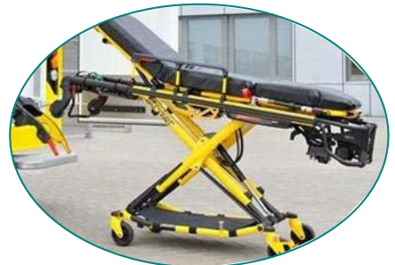
Performance Pro de STRICKER